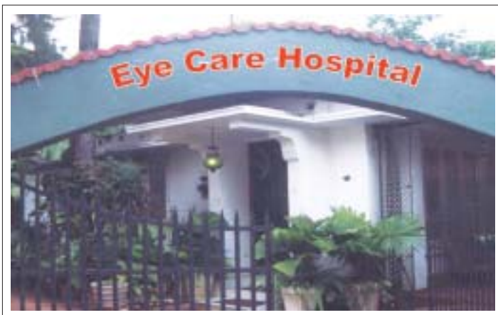
වර්තමාන අක්ෂි රෝහල නුගේගොඩ.

හෙල්ප් ඒජ් ආයතනය මගින් දිවයිනේ අසරණ ජ්‍යෙෂ්ඨ පුරවැසියන් වෙනුවෙන් ඉදිකරන මෙම රෝහල මගින් ඔවුන්ගේ දෘෂ්‍යාබාධ සඳහා ඉතා විශිෂ්ඨ සහ පුළුල් සේවාවක් ලබාදීමට හැකිවනු ඇතැයි හෙල්ප් ඒජ් ශ්‍රී ලංකා ආයතනය විශ්වාස කරයි.