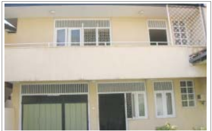
වැල්ලවත්තේ නව රෝහල ඉදිකිරීමට බලාපොරොත්තුවන ස්ථානය.